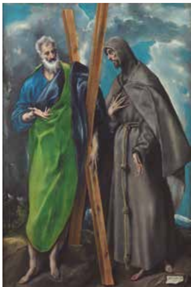
El Greco, San Andrés y san Francisco