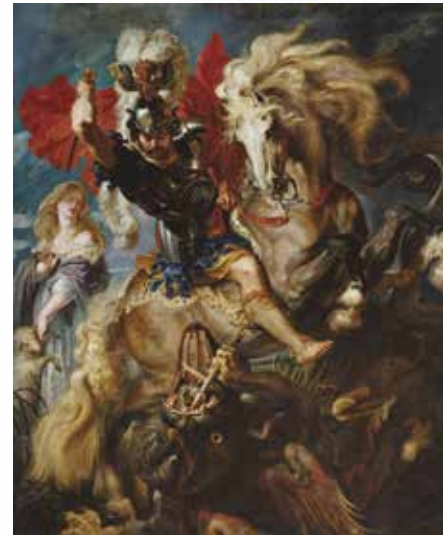
Pedro Pablo Rubens, Lucha de san Jorge y el dragón