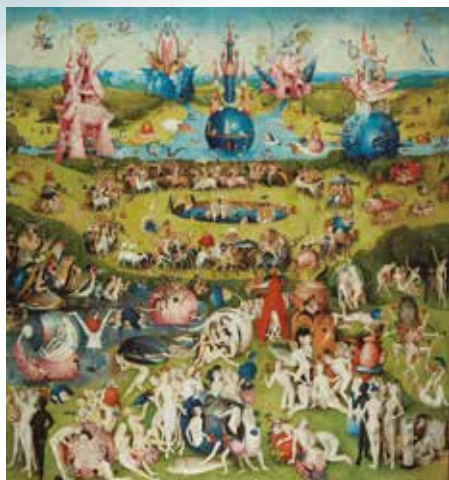
El Bosco, Tríptico del Jardín de las delicias (detalle)