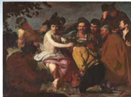
Diego Velázquez, Los borrachos o El triunfo de Baco © Museo Nacional del Prado