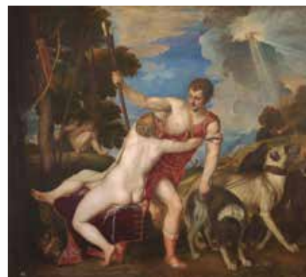
Tiziano Vecellio di Gregorio, Venus y Adonis