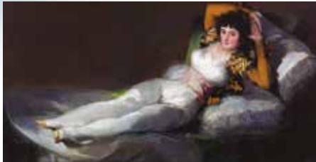
Francisco de Goya, La maja vestida