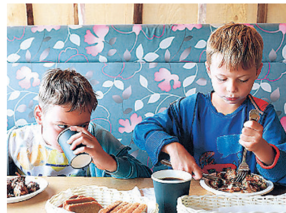
El estudio se ha realizado entre menores con edades de entre 5 y 14 años

Por lo que se refiere a la actividad física, concluye que el 30% de los menores no realiza ningún tipo de ejercicio fuera del entorno escolar, mientras que el tiempo de exposición a las pantallas es de entre 2 y 3 horas diarias. Por su parte, el dietis-